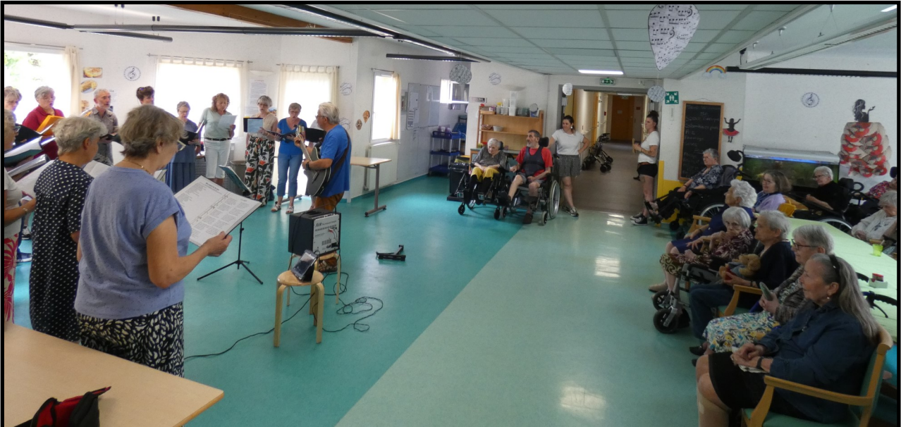
La chorale d'Arcambal accompagnée d'un guitariste.