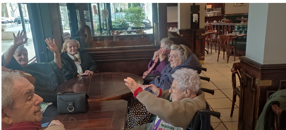
Sortie au Bordeaux avec le mini bus pour, sim- plement, boire un verre...

Toutes nos pensées accompagnent les familles et les proches de