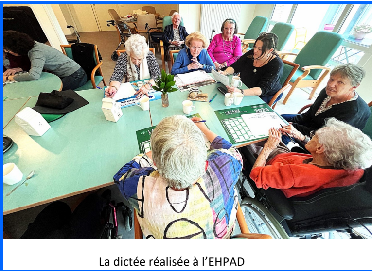
La dictée réalisée à l'EHPAD

Sortie au marché de Lalbenque le samedi matin