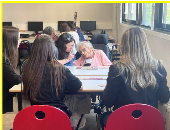
Rencontre avec des lycéens au Lycée Clément Marot

Visite du Musée Henri Martin à Cahors (plusieurs visites sont prévues)