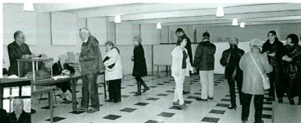
On fait même la queue pour voter !